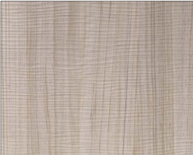
WL Maple Alpine

Not only visually, but also haptically an experience. Innovative manufacturing processes allow a particularly lively wood structure and resource-saving use of raw materials.