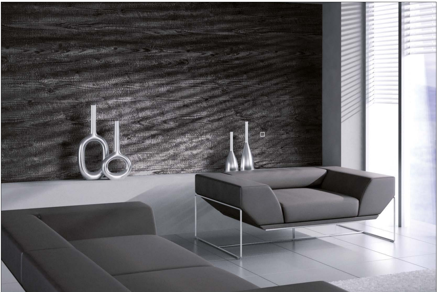
□ WL Carbonized Wood

Zusätzlich verfügbar in den Produktgruppen: Also available in the product groups: Antigrav & NATURE-LINE