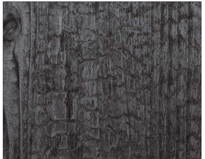
WL Carbonized Wood