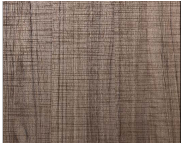
WL Nutwood Country