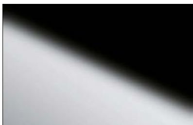
DM OPTICAL MIRROR Silver AR 2800 x 1250 / NA 20877