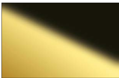
DM OPTICAL MIRROR Brass AR 2800 x 1250 / NA 21242