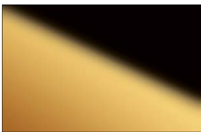
DM OPTICAL MIRROR Gold AR 2800 x 1250 / NA 21243